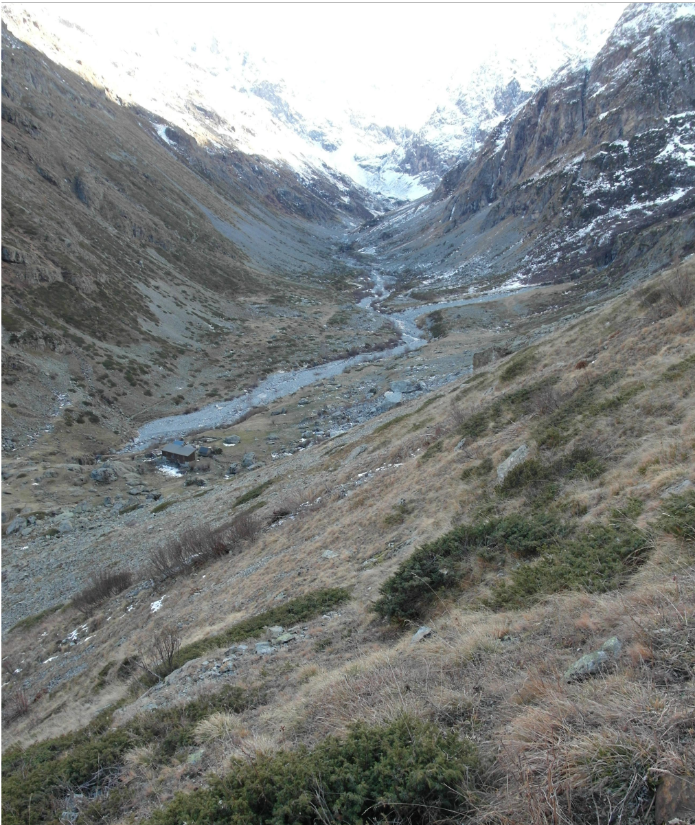
Photographie n°6, vue du hameau et du refuge de la Lavey depuis le versant Nord-Est